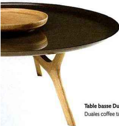
Table basse Duales, pour Saint-Luc Édition. Duales coffee table for Saint-Luc Édition.

Malgré un agenda plus encombré que celui d'une rock star, il trouve également le temps de plancher sur une exposition personnelle pour la galerie BSL, dévoilée lors du salon Design Miami de juin prochain. «Je suis dans une course contre le temps en permanence, explique le designer pressé, mais je le fais désormais avec plus de sérénité et de sagesse qu'avant.» CQFD. ▮