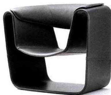
Table Deriva, pour Ceccotti Collezioni. Fauteuil club Air Lux, pour Fasem. Tapis Plis, pour Chevalier Édition.