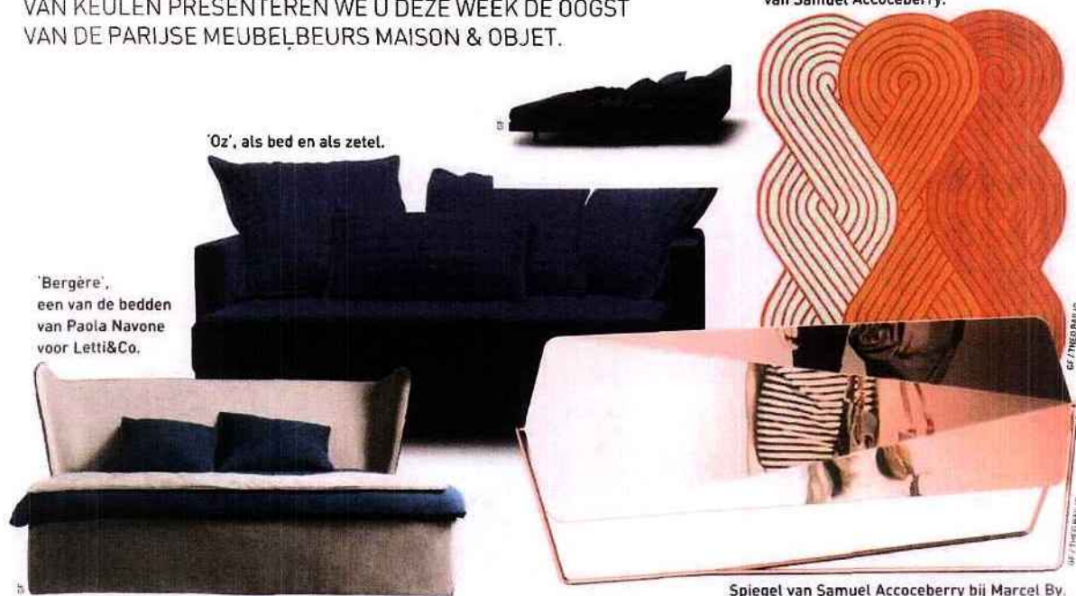
'Oz', als bed en als zetel.

Tapijt bij Chevalier édition van Samuel Accoceberry.