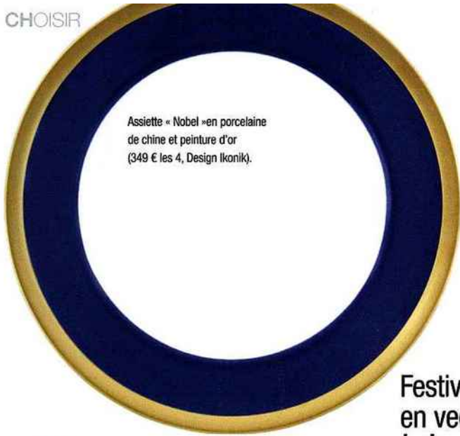
Assiette « Nobel » en porcelaine de chine et peinture d'or (349 € les 4, Design Ikonik).