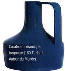
Carafe en céramique turquoise (160 €, Home Autour du Monde).