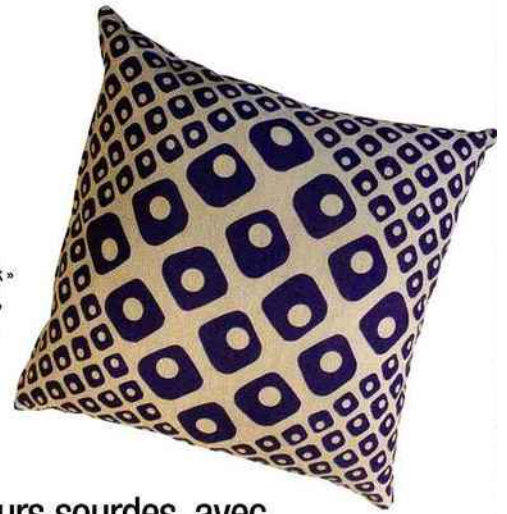
Coussin « Patchwork » en coton et lin (68 €, Franck Josseaume).

Festival de couleurs sourdes, avec, en vedette, des camaïeux de bleus... Une valeur sûre !