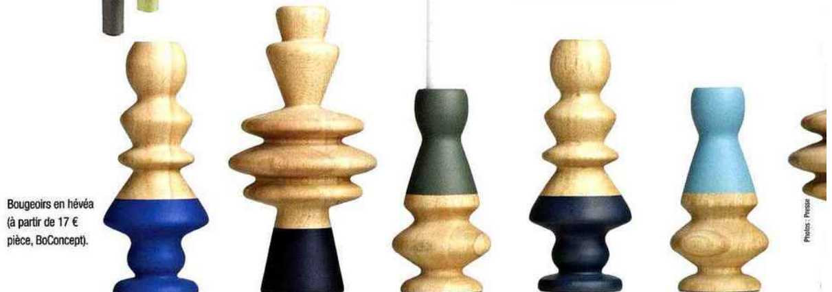
Bougeoirs en hêvéa (à partir de 17 € pièce, BoConcept).