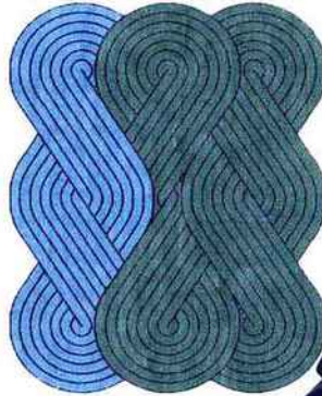
Tapis « Tresse » en laine et/ou soie, noué main, de Samuel Accoceberry (2917 €, Chevalier Edition).