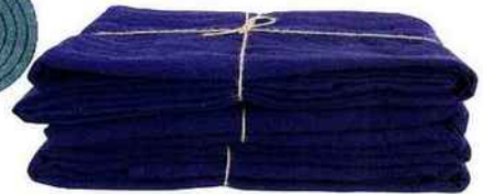
Linge de lit en lin indigo (à partir de 39 € la taie, Merci). ADRESSES EN FIN DE MAGAZINE