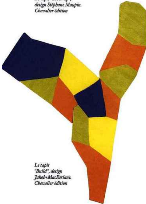
Le tapis "Build", design Jakob+MacFarlane. Chevalier édition