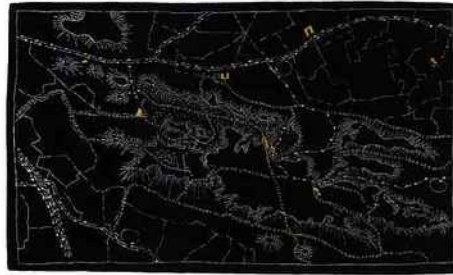
Le tapis "Pistes", design Nicolas Michelin (ANMA). Chevalier édition