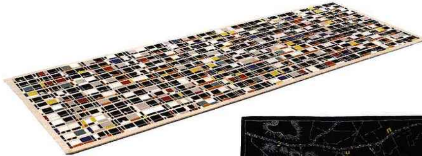
Le tapis "Blow-up", design Stéphane Maupin. Chevalier édition