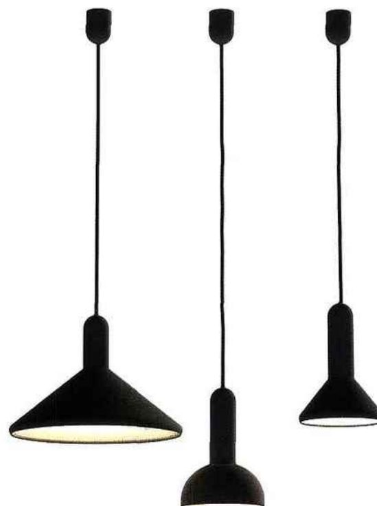
Torch 500 ESTABLISHED & SONS