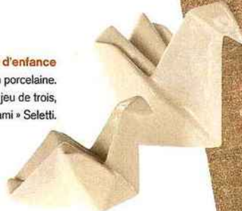
Un goût d'enfance Les cocottes en porcelaine. 50 € le jeu de trois, « Mon origami » Seletti.

Travaux pratiques. « Matière à penser », un stage au musée du quai Branly à ne pas manquer pour aborder le savoir-faire des femmes Miào, ethnies minoritaires du sud-ouest de la Chine. Pour approcher la confection de leurs somptueux costumes indigo, petites œuvres d'art où plis et broderies rivalisent de virtuosité. Trois séances de trois heures les 6, 13, et 20 juin, 70 €. Rés. : 01 56 61 71 72.