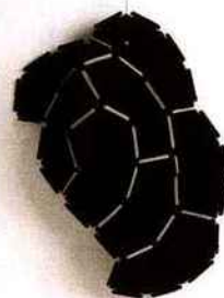
Puzzle À assembler, à partir de 285 € les huit éléments. « Clouds » R. et E. Bouroullec, Kvadrat.