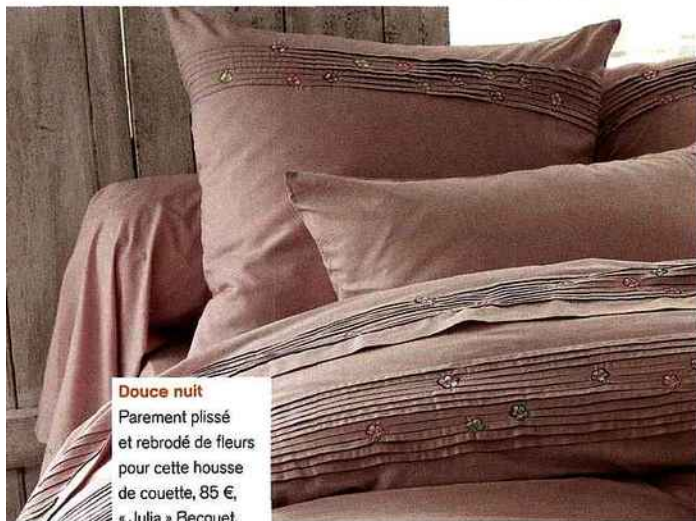
Douce nuit Parement plissé et rebrodé de fleurs pour cette housse de couette, 85 €, « Julia » Becquet.