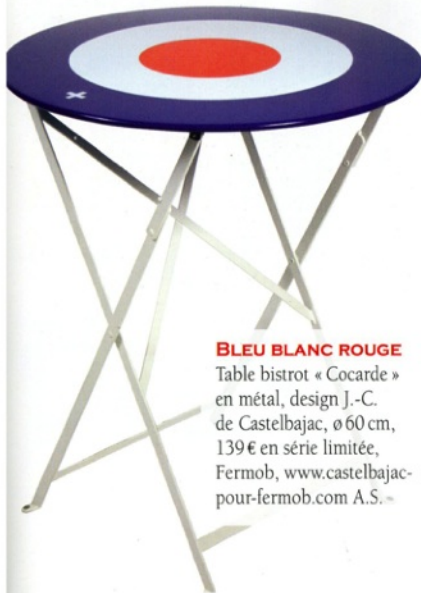
BLEU BLANC ROUGE Table bistrot « Cocarde » en métal, design J.-C. de Castelbajac, ø 60 cm, 139 € en série limitée, Fermob, www.castelbajac-pour-fermob.com A.S.