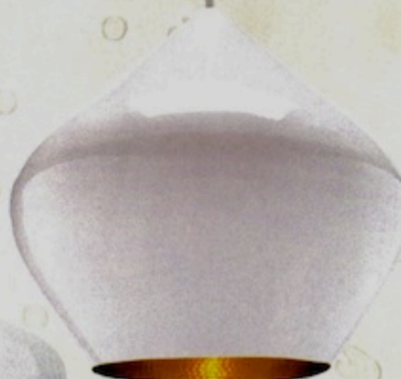
"Beat Light Stout" Suspension, design Tom Dixon, 999 € (Tom Dixon).