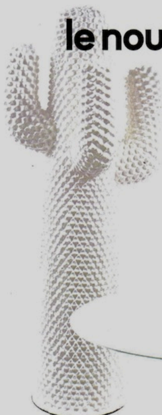
"Cactus" Porte-manteau, design Guido Drocco et Franco Mello, 3 950 € (Gufam).