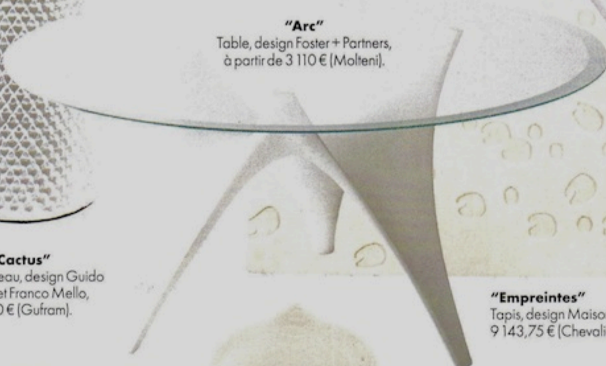
"Arc" Table, design Foster + Partners, à partir de 3 110 € (Molteni).