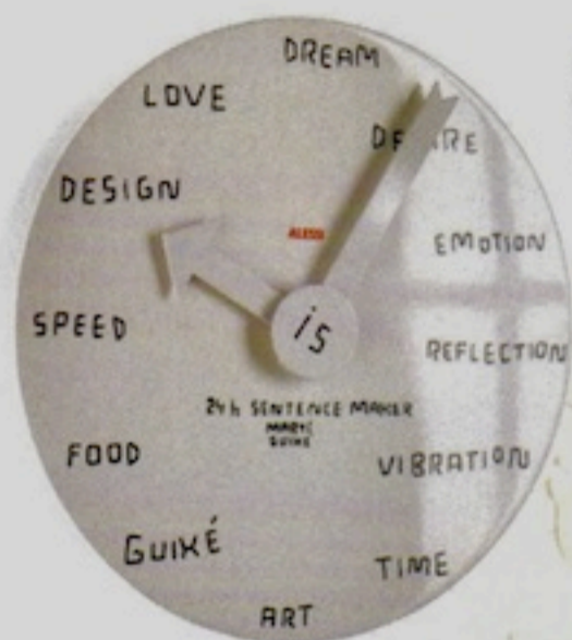
"Blank Wall Clock" Horloge, design Marti Guixé, 105 € (Alessi).