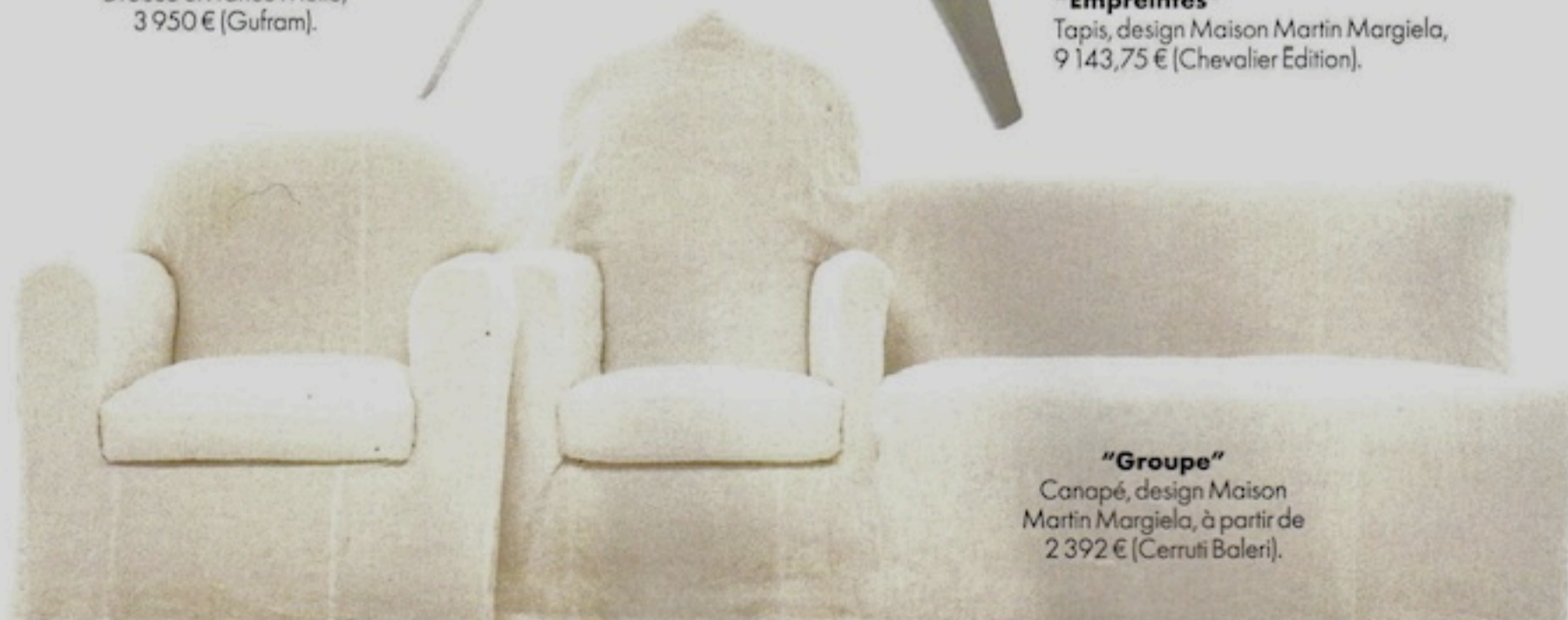
"Groupe" Canapé, design Maison Martin Margiela, à partir de 2 392 € (Cerruti Baleri).